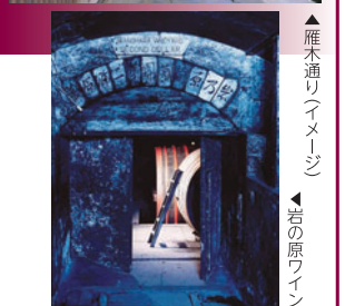
雁木通りイメージ 岩の原ワイン