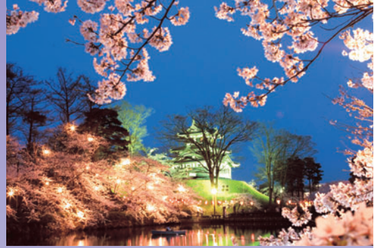
高田城三重櫓と夜桜(イメージ)

公園周辺には約4,000本の桜の木が植り、3,000個のポンボリが日没から点灯します。※高田公園は「日本の歴史公園100選」に選定されています。